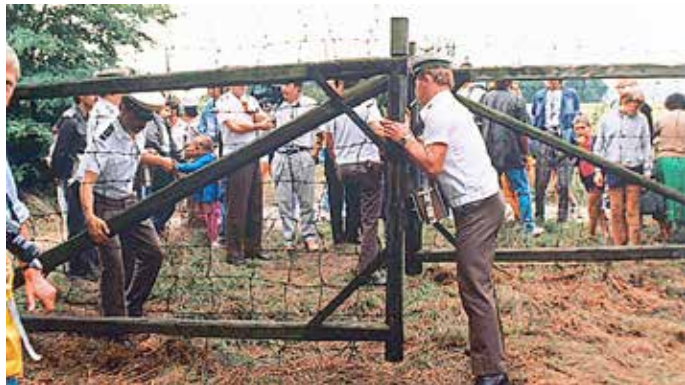
Szene an der ungarisch-österreichischen Grenzanlage am 19. August 1989

Im November werden es 35 Jahre, dass die Berliner Mauer als Symbol der Trennung von Ost und West gefallen ist. Die Friedliche Revolution in der DDR machte es möglich. Doch es gab noch weitere Schritte, die den Weg zur Freiheit markieren. Hierzu zählt das paneuropäische Picknick 1989. Was war geschehen?