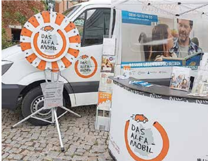
Am ALFA-Mobil-Stand informieren Mitarbeiter interessierte Bürger und Menschen mit Lese- und Schreibschwierigkeiten.

Zeitung lesen, Notizen für die Kinder schreiben, im Büro E-Mails verschicken - für viele Erwachsene in Neustadt an der Orla sind diese Alltagshandlungen kaum zu überwindende Hürden. Um auf Hilfsangebote aufmerksam zu machen, kommt das ALFA-Mobil des Bundesverbandes Alphabetisierung und Grundbildung e.V. (BVAG) am 6. August 2024 nach Neustadt an der Orla. Von 9 bis 13 Uhr wird es beim Rewe-Markt, Zum Festplatz 3 in Neustadt (Orla) stehen.