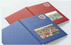
25 Jahre nach der ersten Ortschronik zur 725-Jahrfeier wird die Geschichte von Knau in einem zweiten Band fortgeschrieben.

Am Donnerstag startet der viertägige Feiermarathon 17 Uhr mit der feierlichen Eröffnung im Festzelt am Rittergut Knau. Ein besonderer Höhepunkt ist dabei die Lesung aus der fortgeschriebenen Chronik, die zur 925-Jahrfeier von Knau erstmals erschien und nun um interessante und unterhaltsame Fakten aus weiteren 25 Jahre ergänzt wurde. Musikalisch umrahmt wird der Abend durch die Musikschule Saale-Orla.