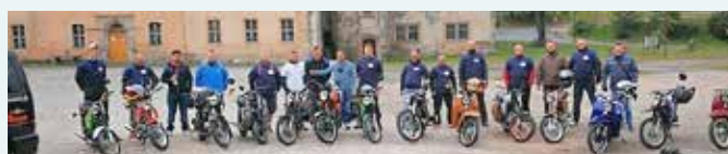
Nach ausgiebiger Ausfahrt präsentieren die Simsonfreunde ihre gepflegten Schätzchen.

Mit dem Sonntag erreicht der versprochene Feiermarathon seinen Abschluss in einem Feuerwerk aus Angeboten für die ganze Familie. Schon ab 10 Uhr geht es los. Die Knauer Simsonfreunde laden zu einer 50 km langen Ausfahrt ein und freuen sich auf viele Gleichgesinnte, die ihre Leidenschaft für die DDR-Kultmpeds und die Freude am Basteln und Schrauben teilen.