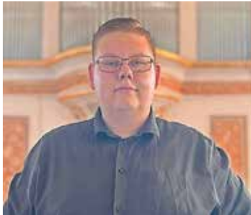
Kantor Tom Anschütz