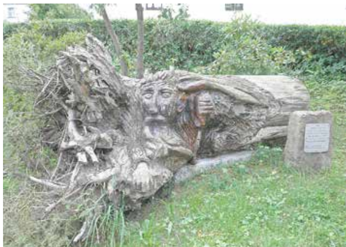
Der Waldgeist wartet auf das was kommt

Vom 13. bis 15. September feiert die Waldgeistgemeinde Breitenhain ihre traditionelle Kirmes.