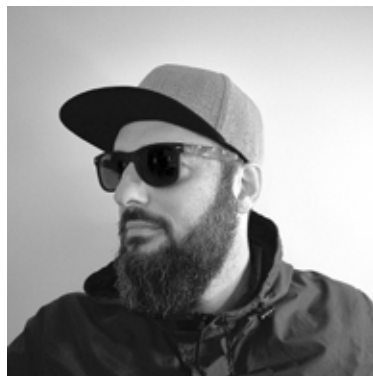
Sugar D aus dem Plauerer Club Zooma zählt zum Line Up beim Electronic Halloween

Sichert euch jetzt das vergünstigte Vorverkaufsticket für 9,50 Euro in der TouristInformation im Lutherhaus und seid gespannt auf die schaurig-schönste Nacht des Jahres.