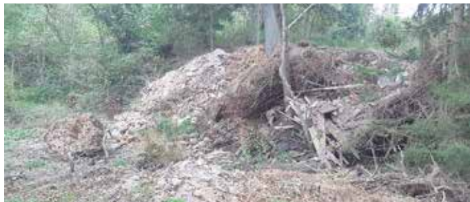
Illegale Entsorgungen in der Gemarkung Köthnitz, Flurstück 48/3

In der Gemarkung Köthnitz der Stadt Neustadt wird zunehmend das Problem illegaler Müllansammlungen durch ortsnahe Bürger deutlich. Was viele Bürgerinnen und Bürger möglicherweise als Kavaliersdelikt ansehen, stellt eine ernstzunehmende Ordnungswidrigkeit dar und ist sogar eine Straftat nach dem Thüringer Waldgesetz (ThürWaldG). Wer Müll unrechtmäßig entsorgt, handelt nicht nur gegen die Ordnung, sondern schädigt auch nachhaltig die Natur und das empfindliche Ökosystem. Durch die illegale Müllentsorgung in den Wäldern rund um Köthnitz werden zahlreiche Tier- und Pflanzenarten in ihrem Lebensraum bedroht. Besonders betroffen sind streng geschützte Arten, wie seltene Vogelarten und Fledermäuse aber auch viele Pflanzenarten. Diese stehen unter besonderem Schutz, da sie entscheidend für das ökologische Gleichgewicht sind. Der Müll in den Wäldern stellt für diese Arten eine direkte Gefährdung dar, da er deren Lebensraum zerstört und auch zu Vergiftungen führen kann.