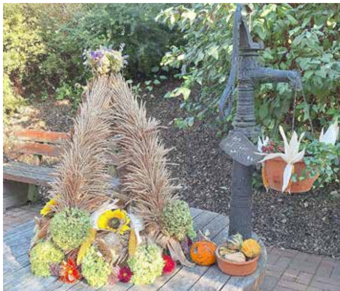
Der herbstlich geschmückte Brunnen in Stanau

Der Herbst ist in Neustadt und seinem Ortsteil Stanau eingezogen. In der Zeit des Sommers ist sehr viel geschehen, worüber diese kleine Zusammenfassung berichten will. Am zweiten Juliwochenende hat ganz Stanau ein wunderschönes Dorffest feiern können. Egal ob zur gemütlichen Runde am Freitagabend, zum stimmungsvollen Tanz am Samstagabend im Festzelt oder zum abwechslungsreichen Familienfest mit seiner Zweirad-Oldtimer-Ausfahrt: Stimmung, Gäste und das Wetter wirkten perfekt zusammen.