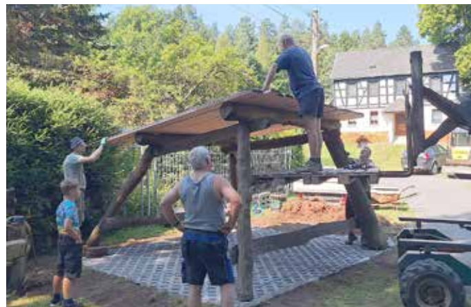
Instandsetzung der Überdachung der „Pilgerhütte“