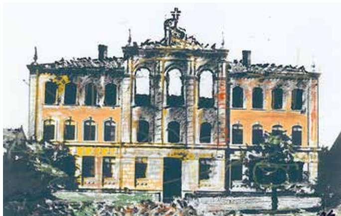
Zeichnung des heutigen Ortaal-Gymnasiums nach einem Bombenangriff

Historischer Stadtrundgang zu den Stätten der Kriegszerstörung und der Todesmärsche