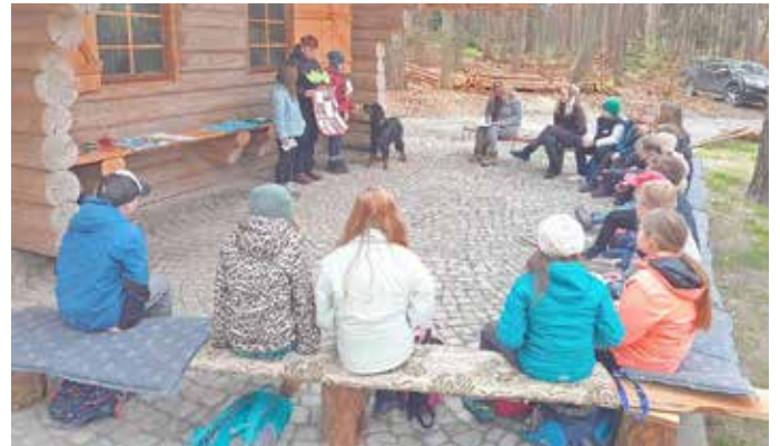
Präsentation der Natur des Jahres 2024 in der Draußenschule am Blockhaus bei Neustadt (Orla); Foto: Stierand

Über die Jahre ist ein Fundus an bewährten Methoden und Lehrplan-konformen Ideen entstanden, der mit neuen Impulsen und Ideen bereichert wird. Aufgrund der vielfältigen Lebensräume und Waldbilder im Revier Strößwitz sind Themen wie Waldwiese, stehendes Gewässer/ Teich oder Hecke bezogen auf die Lehrplaninhalte sehr gut nutzbar, der Lehrpfad mit seinen Stationen und der guten Erreichbarkeit ist ein idealer Lernort. Neu entstanden ist 2024 eine Sommerterrasse am Blockhaus, die sich ideal für Multiplikatorenschulungen in der Waldpädagogik für Pädagogen und Erzieher eignet.