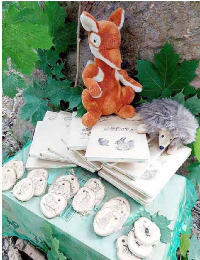
Draußenschule-Wald-Schuleinführung mit Übergabe der Waldbücher 2024

Etabliert hat sich zu Beginn des Waldjahres - jetzt nach den Herbstferien - eine „Waldschuleinführung“ für die Erstklässler. Sie erhalten eine junge Douglassie in einer Zuckertüte mit dem Auftrag, diese mit ihrer Familie da zu pflanzen, wo sie sie regelmäßig besuchen und hegen können - analog ihrer Schulzeit und ihres Schulwissens, das wachsen soll.