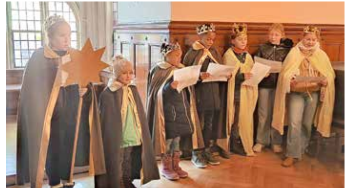
Hier beim Besuch im Rathaus.

Am 9. März sind in unserem Bistum wieder die Gremienwahlen. Gewählt wird in den großen Kirchorten unserer Kirchengemeinde der Kirchenvorstand sowie jeweils der Kirchortrat. Weitere Informationen zu den Kandidaten in Neustadt und Ablauf der Wahl entnehmen Sie bitte dem Schaukasten, unserer Internetseite oder den Vermeldungen in der Kirche.