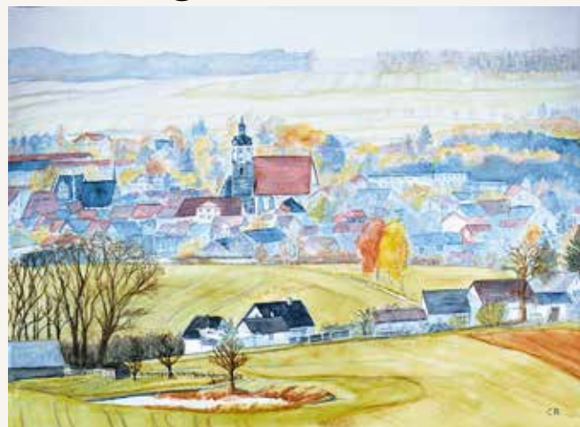
Ansicht Neustadt (Orla), Aquarell, Christa Reuter

Antje Zehm Neustädter Mal- und Zeichenzirkel e.V.