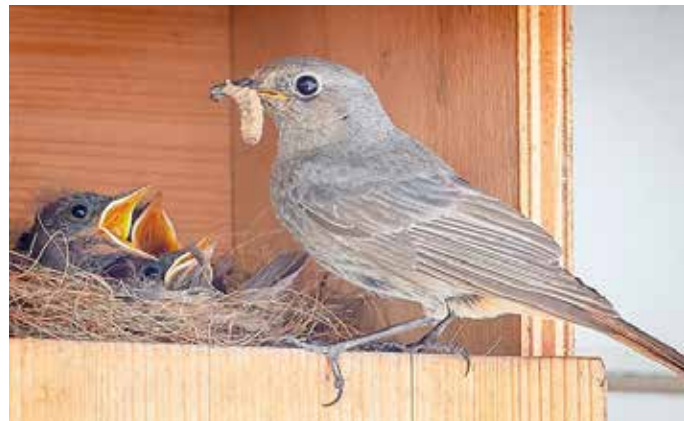
Hausrotschwanzweibchen am Nistkasten, Foto: Wolfgang Fritz/NABU-naturgucker.de

nahrung findet. Als Insektenfresser ist er vom Rückgang seiner Nahrung besonders durch die Landwirtschaft oder „aufgeräumter“ Gärten betroffen. Mit einem Nistbrettchen unter einem (Vor-)Dach oder Halbhöhlen als Nistkasten an einer Gebäudewand kann man ihm den Nestbau erleichtern. Er ist bei der Suche nach einem Brutplatz nicht wählerisch. Sein ausdauernder Gesang ist schon eine Stunde vor Sonnenaufgang zu hören, den er bis zu sechs Stunden lang vortragen kann.