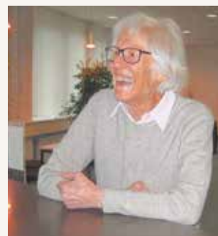
Christa Reuter