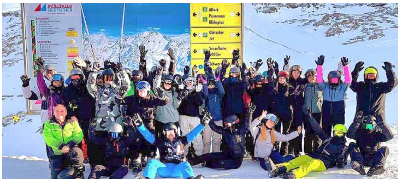
Skilager des Gymnasiums Neustadt 11. Klasse in Österreich