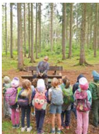
Bewohner der Baumkrone erspähen

Gerade in Zeiten der Natur entfremdung braucht es alle Kraft und viele Freunde des Waldes, die sich für unsere Kinder einsetzen: Um zahlreichen Thüringer Schulklassen zu ermöglichen, einen besonderen Tag im Wald vor ihrer Schul- oder Kindergartentür zu erleben, benötigen wir Ihre Unterstützung. Lassen Sie uns gemeinsam daran arbeiten, dass wir den Kindern den Lernort Wald und seine Bewohner immer wieder erlebbar machen können! Jede noch so kleine Unterstützung - jeder Euro - hilft, die Qualität unserer Bildungsarbeit zu erhalten.