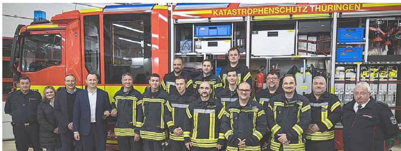
Neues Katastrophenschutzfahrzeug; Foto: Luca Thurau

Das Fahrzeug, welches in einem zukünftigen neuen Gerätehaus in der Wache Neunhofen stehen soll, wird neben den städtischen Einsätzen vor allen Dingen im Bereich des Katastrophenschutzes im ganzen Bundesgebiet eingesetzt werden. Für ein weiteres Fahrzeug für die Wache in Dreba musste die Ausschreibung aufgehoben werden.