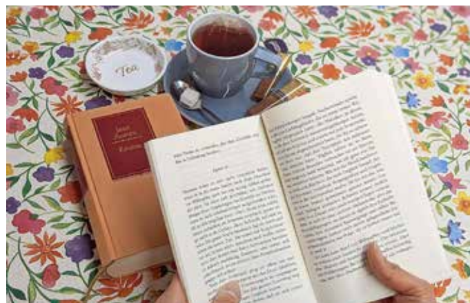
250 Jahre Jane Austen

Wer Lust hat, kann sich außerdem ganztägig an einem Stickbild versuchen. Die Bibliothek ist an diesem open-library-Tag von 10 bis 17 Uhr geöffnet.