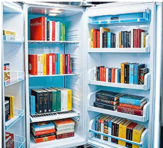
Dank guter Kühlung auch Ende Februar noch frisch.