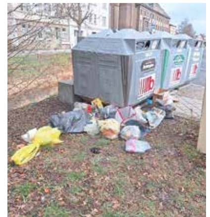
Müll in der Orlagasse

Hierzu passt auch noch die Entsorgung des Silvestermüllberges. Eine Tonne Müll wurde allein nach der Silvesternacht durch unsere Dienstleistungsgesellschaft beräumt. Ich glaube, die wenigsten haben etwas gegen das Feuerwerk zu Silvester. Aber wenn einige Anwohner nicht einmal ihren hinterlassenen Müll vor ihren Häusern entfernen und teilweise kriegsähnliche Zustände, wie an der Kreuzung Rodaer Straße/ Mühlstraße, herrschen, dann müssen wir uns wohl alle Gedanken machen, wie man perspektivisch damit umgeht.